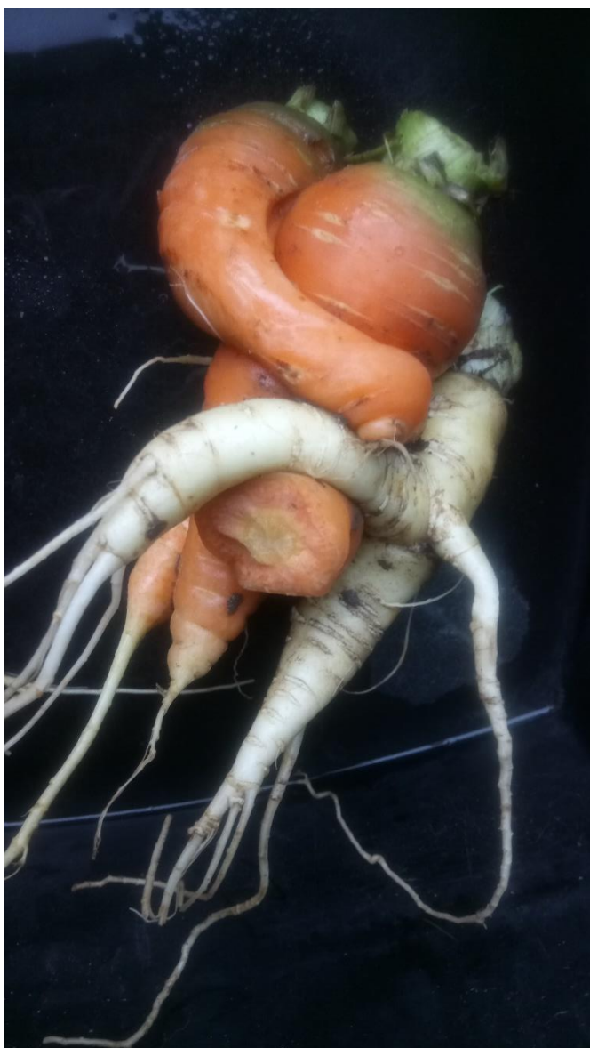
Wortels vinden elkaar geweldig lief.