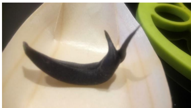
Een echte siamese toverboon.